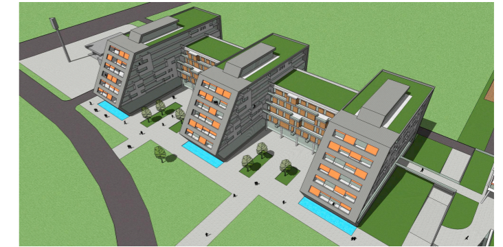
Látványkép a Mezőkövesd út felől