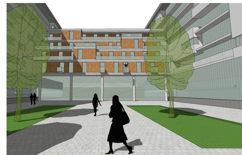
Nézet a Mezőkövesd út felől