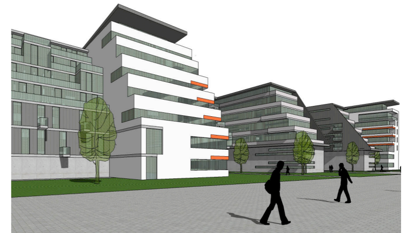
Nézet a Dr. Papp Elemér útról