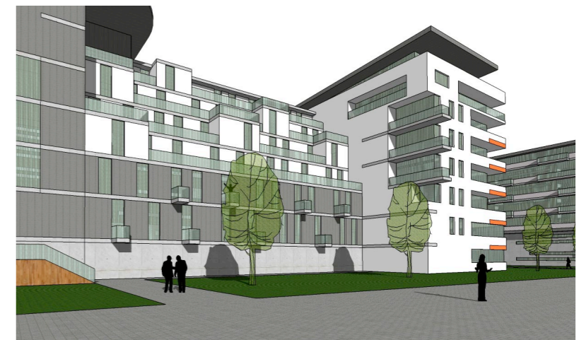
Nézet a Dr. Papp Elemér útról