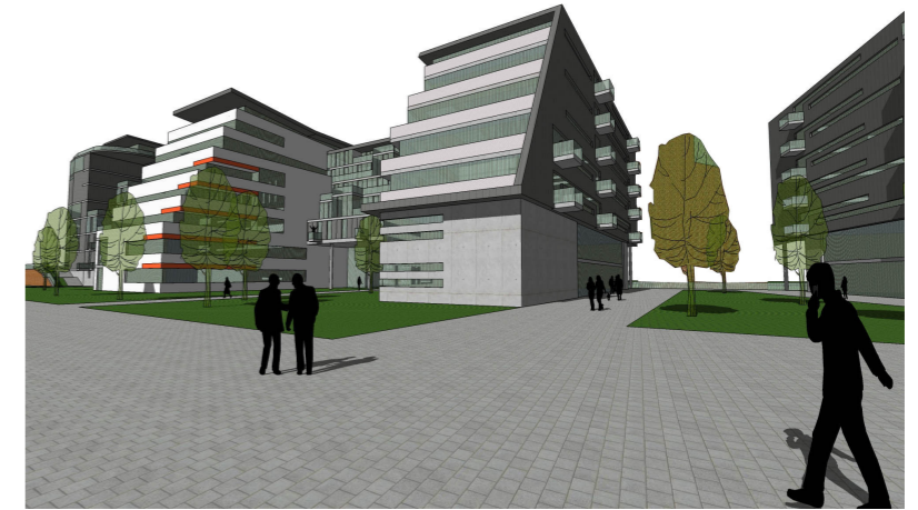
Látványkép a Dr Papp Elemér út felől